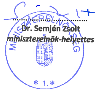
Dr. Semjén Zsolt miniszterelnök-helyettes