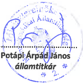
Potápi Árpád János államtitkár

A Bizottság felhívja a Bethlen Gábor Alapkezelő Zrt.-t, hogy az előirányzatok módosításához szükséges intézkedéseket tegye meg.