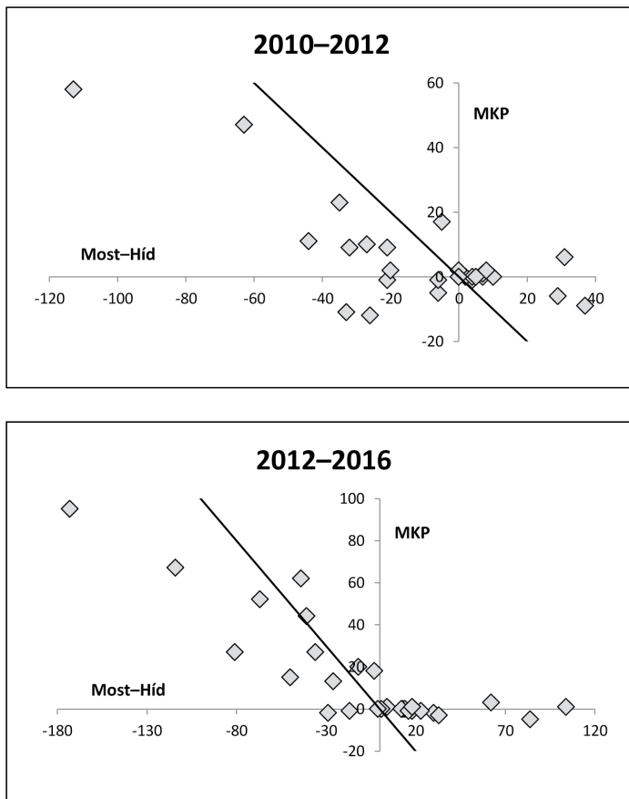
4–5. ábra: A Most–Híd és az MKP szavazótáborának változása 2010 és 2012, valamint 2012 és 2016 között a Szenci járás településein

A kivételek közé tartoz(hat)nak a Pozsony környéki járások, különösen a Szenci, ahol az MKP legnagyobb arányú támogatottságnövekedését tapasztaltuk. Tudjuk, hogy 2012-ben a párt itteni tábora összességében, vagyis az érkezők és a távozők egyenlegeként 153 fővel gyarapodott, a Most–Hídé pedig 296-tal csökkent, míg 2016-ban már 430:261 volt a mérleg. (Megjegyzendő, hogy a járásban Bugárék pártja ekkor még így is közel két és félszer több szavazatot kapott, mint az MKP.) Minket azonban ezúttal is a szavazók tényleges, vagyis települési bontásban kapott mozgása érdekel, aminek alakulását az alábbi két grafikon szemlélteti.