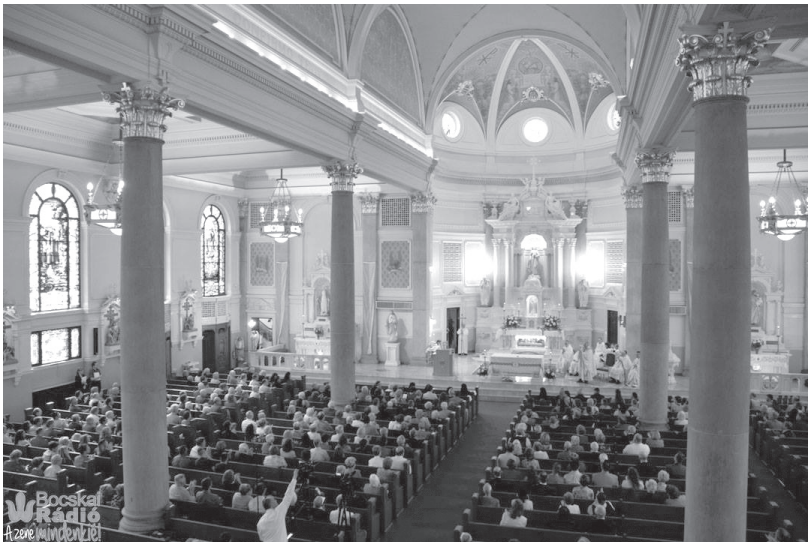
3. kép: A Szent Erzsébet római katolikus templom megalakulásának 125. évfordulóján tartott szentmise 20