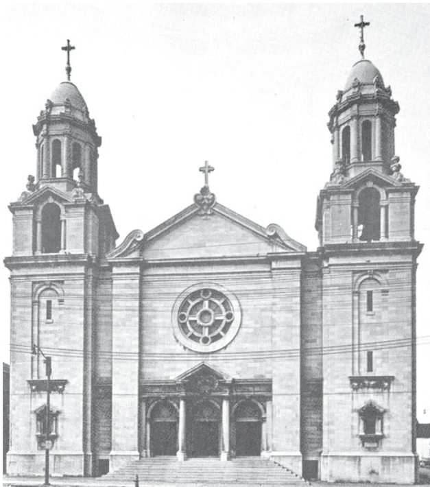
2. kép: Az új Szent Erzsébet római katolikus templom 1922 körül 16

építése 1914-ről 1918-ra tolódott. Az amerikai gazdasági élet, így a clevelandi ipar és gazdaság fellendülése 1918-ban lehetővé tette az új templom építésének megkezdését. Az alapkövetételének szertartását az akkori megyés püspök, J. P. Farrelly végezte. A templomépítés munkálatait az első világháború, a pénzhiány és az 1919-i rendkívül kemény tél késleltették. 1922. február 19-én Schrembs József clevelandi püspök megáldotta a templomot. Időközben az egyházközség létszáma egyre jobban növekedett. A már két segédlelkészt igénylő lelkipásztorra egyre több munka hárult. 1918-ban csaknem 1500 család tartozott az egyházközséghez, 455 keresztelezés, 108 esküvő és 206 (ebből 70 gyermek) temetés volt. Az általános 8 osztályú iskola 14 tantermében 1114 gyermek tanult. Az iskolában 13 szerzetes nővér és egy világi tanár tanított. A különféle felnőtt és ifjúsági egyletek több mint 2300 tagot számláltak. 14 Az 1920/21-es tanévben az egyházközség iskolájába beiratkozott tanulók létszáma elérte a mindenkori csúcst: 8 osztály, 16 tanterem, ahol 15 orsolyita nővér és 1 világi tanár 1159 tanulót tanított. 15