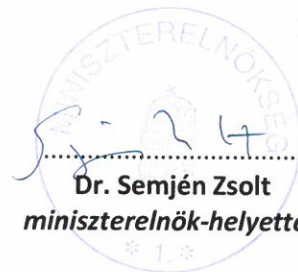
Dr. Semjén Zsolt miniszterelnök-helyettes