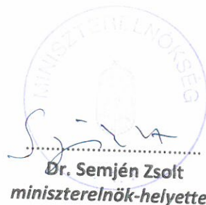
Dr. Semjén Zsolt miniszterelnök-helyettes